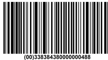
Slika 3—4: Koda za GSIN in SSCC