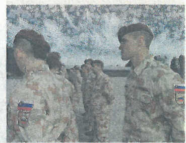
Včeraj se je iz Afganistana v Slovenijo vrnilo še zadnjih šest vojakov Slovenske vojske, ki so v deželi pod Hinkušem urili afganistanske varnostne sile. Z njihovo vrnitvijo se je končala operacija SV v Afganistanu, ki je potekala od leta 2004. K. H.

Včeraj se je iz Afganistana v Slovenijo vrnilo še zadnjih šest vojakov Slovenske vojske, ki so v deželi pod Hinkušem urili afganistanske varnostne sile. Z njihovo vrnitvijo se je končala operacija SV v Afganistanu, ki je potekala od leta 2004.