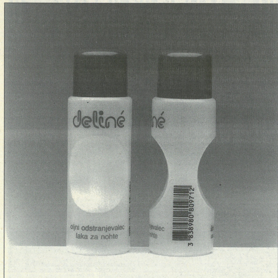
DELINÉ odstranjevalec laka za nohte - primer kode, tiskane brez bele podlage direktno na prozorno embalažo