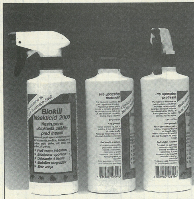
BIOKILL insekticid - primer različnih kod za isti izdelek zaradi različne izvedbe zapiranja embalaže (z razpršilcem in brez njega)